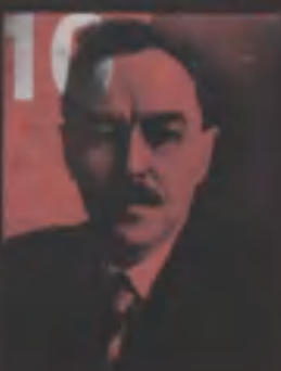
1 Постышев П.П.